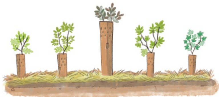
Schéma d'une plantation avec plants protégés et paillés, après la reprise