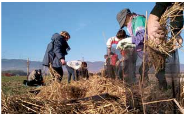
Le projet « En route vers 50 km de haïes » est financé grâce aux partenaires de l'AAP TVB.

Avec les collectivités, nous réfléchissons aux aménagements à dimensions environnementales et sociales : parcs urbains, vergers communaux, corridors écologiques, etc. Nous pouvons aussi leur proposer un accompagnement en mode action-formation.